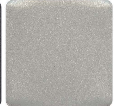
ALLUMINIO PADOVA SENSITIVE COLLECTION