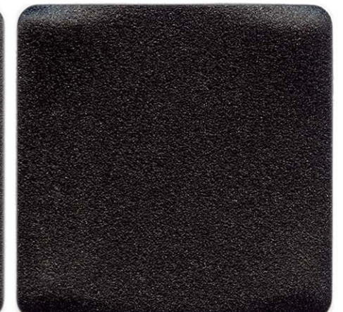
NERO TREVISO SENSITIVE COLLECTION