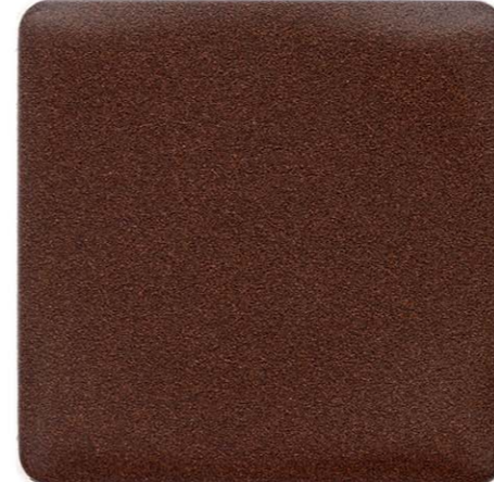
MARRONE VERONA SENSITIVE COLLECTION