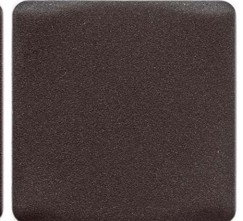
BRONZO SABLÉ SENSITIVE COLLECTION