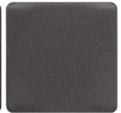
GRIGIO MARMO ANTICO SENSITIVE COLLECTION