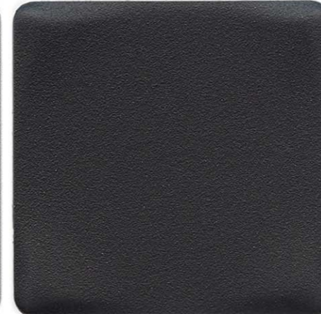
GRIGIO GRAFITE SENSITIVE COLLECTION