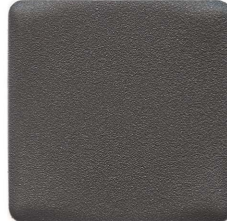
GRIGIO ROVIGO SENSITIVE COLLECTION