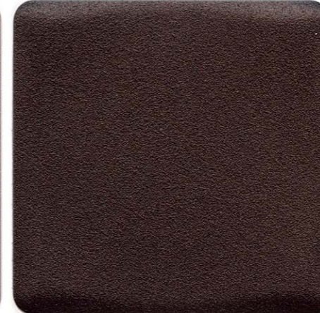
RUGGINE SENSITIVE COLLECTION