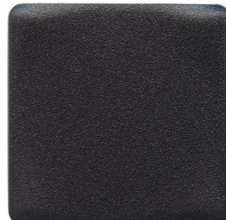
NERO ANTRACITE SENSITIVE COLLECTION