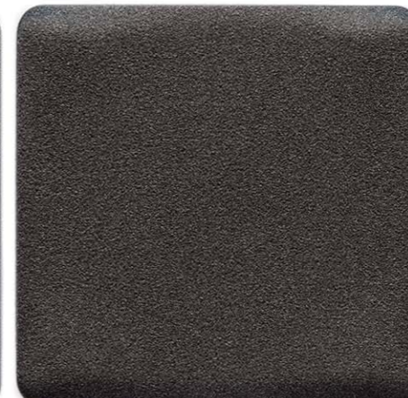
NERO BASSANO SENSITIVE COLLECTION