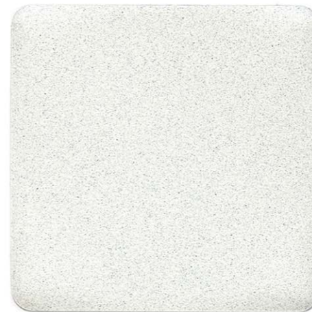
BIANCO MARMO ANTICO SENSITIVE COLLECTION