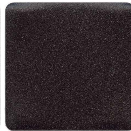
MARRONE MARMO ANTICO SENSITIVE COLLECTION